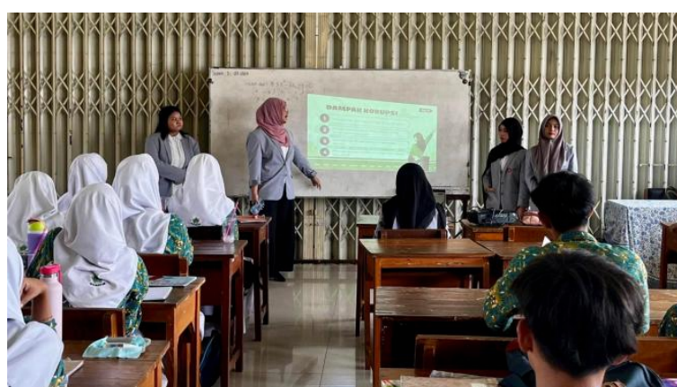
Gambar 4. Pemaparan Materi

Hasil kegiatan menunjukkan bahwa sekitar 95% siswa/i telah mampu memahami dan menjelaskan pengertian korupsi sebagai tindakan memanfaatkan kekuasaan atau kewenangan untuk memperoleh keuntungan pribadi atau orang lain (Komisi Pemberantasan Korupsi, 2022). Selanjutnya, penyampaian materi mengenai peran generasi muda dalam mencegah korupsi, contoh korupsi dari hal kecil, dan sedikit refleksi diri untuk siswa/i di masa depan dilakukan melalui metode presentasi interaktif agar siswa/i memahami materi yang disampaikan dan membuat proses sosialisasi lebih menarik dan tidak monoton.