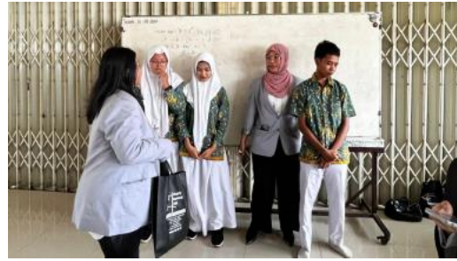
Gambar 7. Foto Penyerahan Hadiah Kepada Peserta Interaktif dan ke-3 Pemenang Games Kahoot