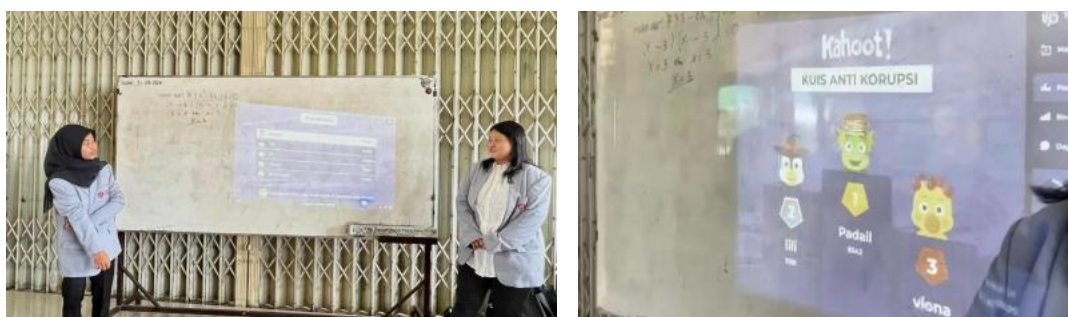
Gambar 6. Sesi Games Kahoot

Meskipun demikian, keterlibatan aktif siswa selama diskusi, refleksi kasus, serta kemampuan siswa menghubungkan perilaku sederhana seperti mencontek dengan tindakan koruptif menunjukkan adanya peningkatan kesadaran moral dan pemahaman kontekstual mengenai pentingnya integritas dalam kehidupan sehari-hari. Temuan ini sejalan dengan pendapat (Dumopoy, 2025; Francis et al., 2024) bahwa pembelajaran berbasis refleksi dan pengalaman dapat membantu meningkatkan kesadaran siswa terhadap nilai moral dan perilaku jujur. Dengan demikian, keberhasilan kegiatan tidak hanya diukur dari skor kuis, tetapi juga dari meningkatnya partisipasi, kemampuan reflektif, dan kesadaran siswa mengenai pentingnya perilaku antikorupsi sejak usia sekolah.