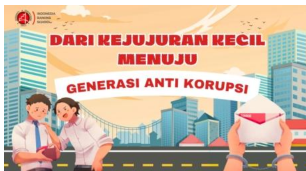
Gambar 3. Judul Utama Slide Presentasi Materi Sosialisasi

dan pemahaman yang bertujuan untuk memperdalam pengetahuan mengenai anti korupsi. Materi-materi yang dibahas mencakup pengertian korupsi, dampak korupsi, peran generasi muda dalam mencegah korupsi, kasus korupsi di Indonesia, dan contoh-contoh korupsi yang relevan ditemui di kalangan remaja seperti menyontek. Keseluruhan materi tersebut dikemas dalam bentuk media visual melalui slide presentasi berjudul " Dari Kejujuran Kecil Menuju Generasi Anti Korupsi " dan video, serta disampaikan dengan cara maupun bahasa yang mudah dipahami. Durasi penyampaian materi ditargetkan paling lama 30 menit sudah termasuk dengan diskusi singkat di beberapa bagian slide materi, QnA maupun sharing session, dan sisa waktu ± 30 menit adalah sesi games melalui Kahoot.