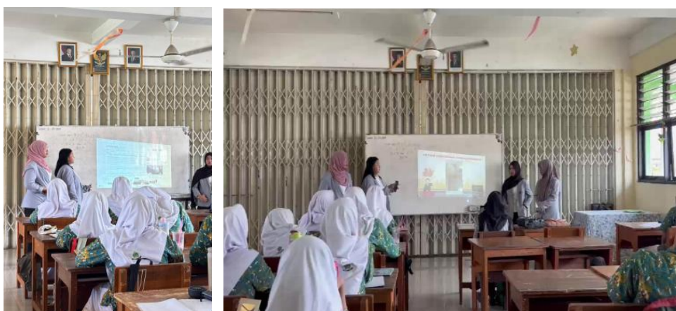
Gambar 5. Penjelasan dan Penayangan Contoh Kasus Korupsi Kecil dan Video Korupsi Besar

Selanjutnya, pemateri juga menampilkan contoh kasus korupsi besar melalui video berita dari kanal Metro TV mengenai penyalahgunaan kekuasaan oleh Bupati Pekalongan. Video tersebut menunjukkan bagaimana jabatan dan kewenangan yang dimiliki seorang pejabat dapat disalahgunakan demi kepentingan pribadi. Melalui kasus tersebut, siswa/i diberikan pemahaman bahwa korupsi dalam skala besar tidak terjadi secara instan, melainkan dapat dimulai dari kebiasaan kecil yang tidak jujur dan terus dilakukan tanpa adanya kesadaran moral maupun integritas dalam diri seseorang.