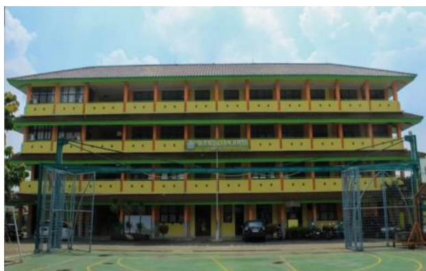
Gambar 2. Lokasi Kegiatan

Kegiatan Pengabdian kepada Masyarakat (PKM) ini dilaksanakan secara luring di MAN 24 Jakarta Timur, yang berlokasi di Jl. Taruna Jaya RT.02/RW.13, Cibubur, Kec. Ciracas, Kota Jakarta Timur. Kegiatan ini diikuti oleh kurang lebih 29 peserta yang terdiri dari siswa-siswi kelas 10. Pelaksanaan kegiatan berlangsung pada hari Kamis, tanggal 16 April 2026, mulai pukul 10.30 WIB hingga selesai di ruangan kelas X - E.