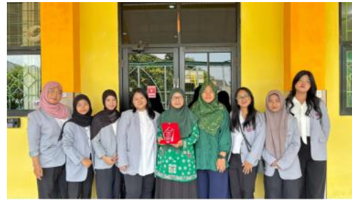
Gambar 8. Foto Bersama dan Penyerahan Plakat

Hasil kegiatan menunjukkan bahwa pendekatan sosialisasi yang dilakukan mampu meningkatkan pemahaman siswa mengenai pentingnya kejujuran dan perilaku antikorupsi sejak dini. Temuan ini sejalan dengan pendapat Murdiono (2016) yang menyatakan bahwa pendidikan antikorupsi yang diintegrasikan dalam proses pembelajaran dapat membantu menanamkan karakter jujur melalui pembiasaan perilaku positif dalam kehidupan sehari-hari. Hal tersebut terlihat dari kemampuan siswa memahami bahwa perilaku sederhana seperti mencontek dan berbohong merupakan bentuk awal perilaku koruptif yang dapat berkembang menjadi tindakan korupsi yang lebih besar di masa depan.