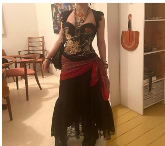
Gambar 2. Perpaduan Kain dengan Pakaian Modern

menunjukkan bahwa Gen Z mampu mengelola berbagai pengaruh budaya yang hadir di sekitarnya secara sadar dan sesuai dengan nilai yang mereka yakini. Mereka tetap memahami identitas budaya lokal sebagai bagian penting dari diri mereka serta bentuk upaya menunjukkan rasa bangga terhadap budaya daerah yang dimiliki. Kondisi tersebut juga menggambarkan bahwa budaya global dan budaya lokal dapat hadir secara bersamaan dalam kehidupan Gen Z dan menjadi bagian dari proses pembentukan identitas di tengah masyarakat yang semakin modern, akibat terhubungnya pengaruh global (Beck, 2015).