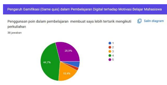
Gambar 4. Hubungan Gamifikasi Dengan Motivasi Belajar Mahasiswa

Penelitian ini tidak mengkaji hubungan antarvariabel melalui analisis statistik lanjutan, seperti uji korelasi atau regresi. Namun demikian, hasil analisis deskriptif memperlihatkan bahwa nilai rata-rata pada variabel gamifikasi maupun motivasi belajar berada dalam kategori tinggi. Temuan tersebut menunjukkan adanya kecenderungan bahwa mahasiswa memiliki persepsi yang baik terhadap penggunaan gamifikasi dalam pembelajaran digital serta tetap mempertahankan motivasi belajar yang tinggi selama mengikuti proses pembelajaran.