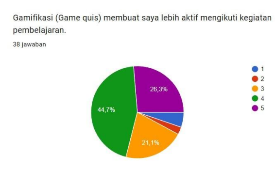
Gambar 2. Diagram Responden Terhadap Penerapan Gamifikasi Dalam Pembelajaran