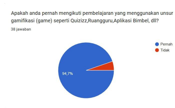
Gambar 1. Diagram Pengalaman Responden dalam Penggunaan Gamifikasi dalam Pembelajaran

aplikasi pembelajaran lainnya yang mengadopsi fitur-fitur permainan guna meningkatkan interaksi dan keterlibatan dalam proses belajar.